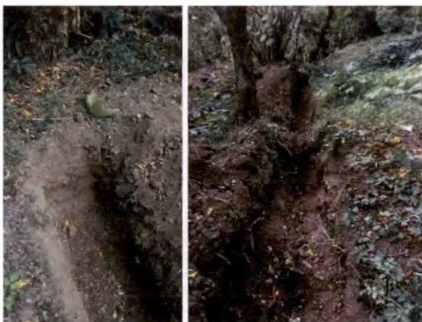
Foto 11 y 12. Estado actual de las acequias con mantenimiento.

Se realizó de forma efectiva el mantenimiento a las 68 hectáreas con estructuras de conservación de suelos, de forma paralela a las brechas corta fuego.