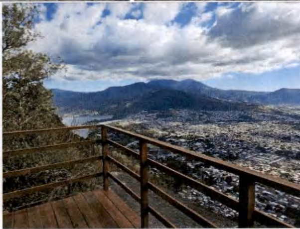
Foto 15, 16, 17, 18, 19 y 20. Mantenimientos descritos anteriormente.