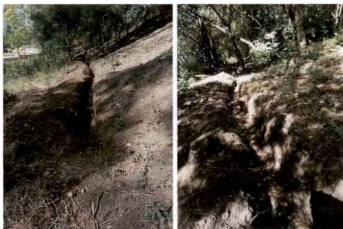
Foto 13 y 14. 2 hectáreas implementadas con nuevas acequias reduciendo erosión en brechas cortafuegos.

El establecimiento de las hectáreas para el año 2023, se realizó en diciembre, posterior al mantenimiento de las brechas corta-fuegos.