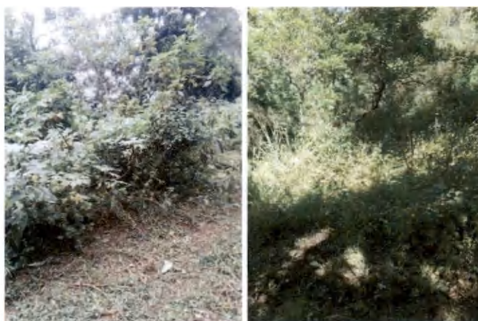
Foto 9 y 10, manejo de regeneración natural (repique o liberación de brotes) (fotografías de octubre y agosto).

Este proceso inició en agosto, y culminó la primera semana de octubre con un total de 5 hectáreas de manejo y mantenimiento donde existe regeneración natural, enriqueciendo con especies atrayentes de fauna y polinizadores.