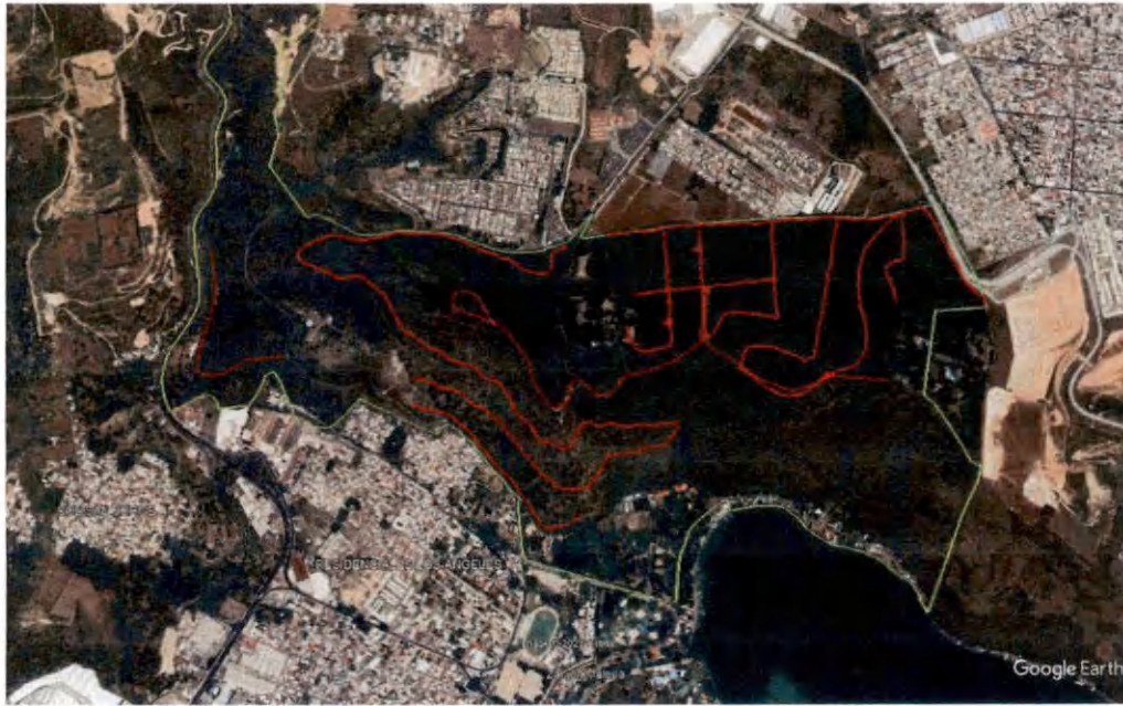
Mapa de ubicación de 17 km de brechas corta-fuegos trabajadas