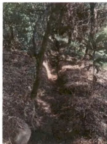
Foto 10 y 11. Estado actual de las acequias con mantenimiento.

El establecimiento de las hectáreas para el año 2023, se realizará en noviembre, cuando las condiciones del suelo son óptimas para la perforación de las zanjas de las acequias.