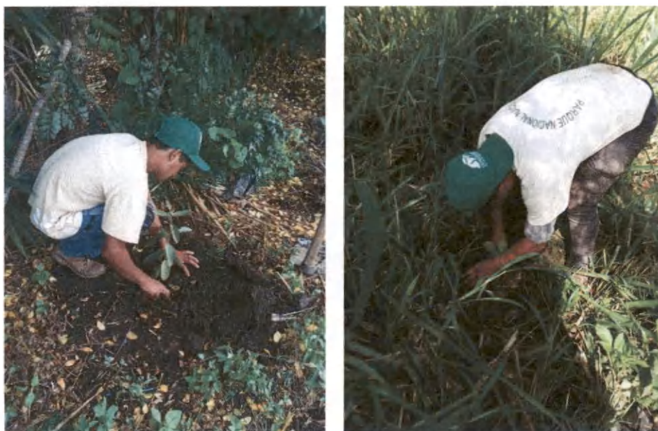
Foto 6 y 7. Reforestación agosto 2023.

Las cinco hectáreas fueron establecidas el mes de agosto. El próximo mes se hará el primer mantenimiento.