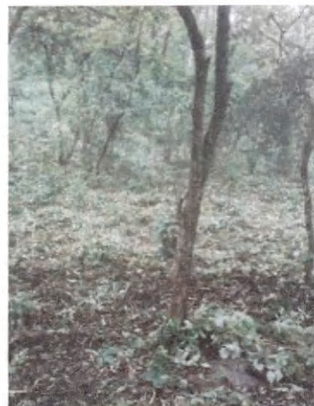
Foto 12 y 13. Área para el establecimiento de estructuras de conservación de suelos.

La vigilancia para el tema de incendios, durante esta temporada, no se realiza, solamente se realizan los recorridos y patrullajes por seguridad. De