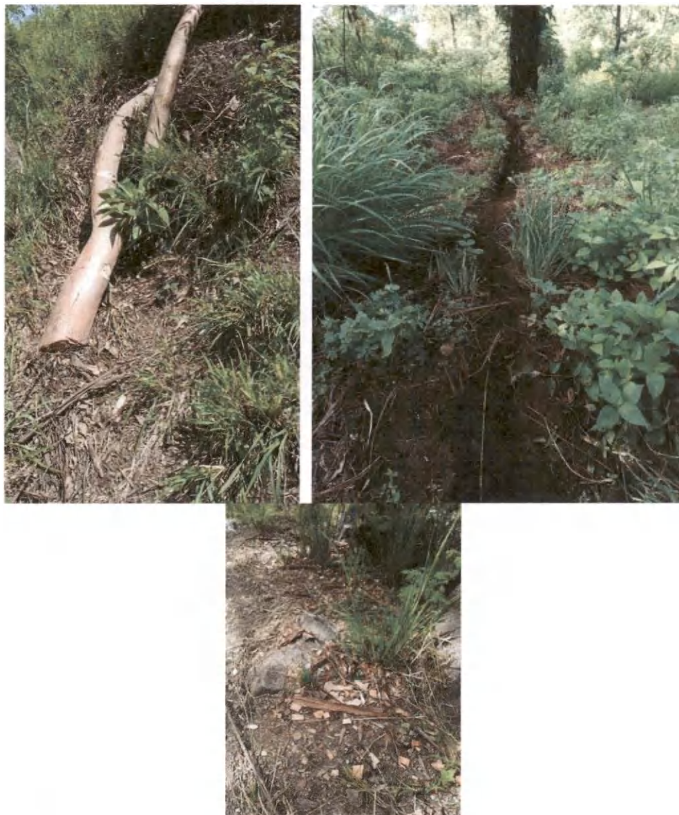
Foto 1, 2 y 3. Trozas taladas de eucalipto, ruta de traslado de trozas y evidencia de preparación de leña.