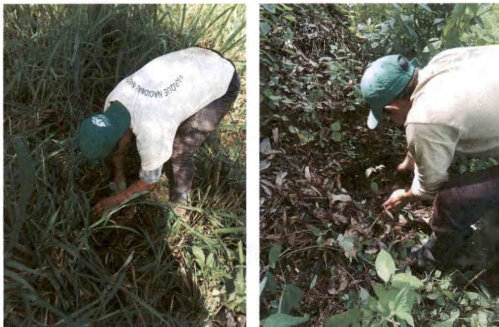
Foto 8 y 9. Mantenimiento en regeneración natural.

Este proceso inició en agosto, y fue finalizado en las primeras semanas de septiembre con tres (3) hectáreas de manejo y mantenimiento donde existe regeneración natural, enriqueciendo con especies atrayentes de fauna y polinizadores.