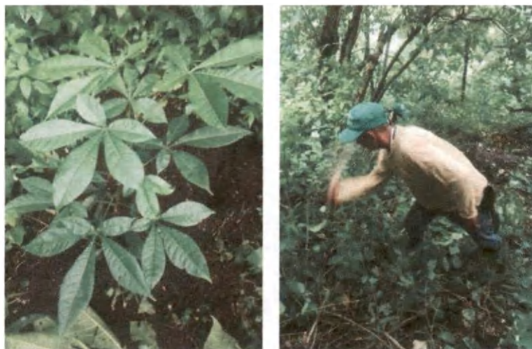
Foto 4 y 5. Área con mantenimiento.

identificada en agosto entre 70 y 80% de árboles que tienen entre 1 a 3 años de haberse establecido.