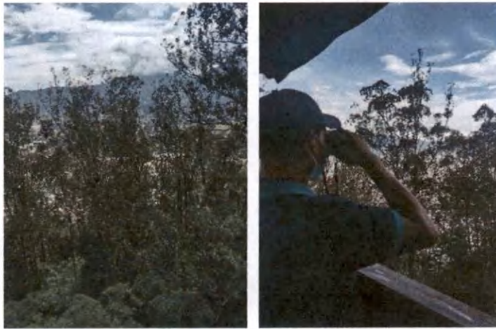
Foto 14 y 15. Monitoreo desde torre de control

forma permanente un elemento de seguridad monitorea desde el mirador principal por cualquier columna de humo.