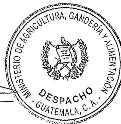
Ing. María Fernanda Rivera Dávila MINISTRA DE AGRICULTURA, GANADERÍA Y ALIMENTACIÓN