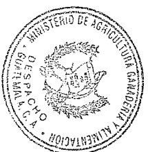
Mario Méndez Montenegro Ministro de Agricultura Ganadería y Alimentación

7 na . Avenida 12-90 zona 13, edificio Monja Blanca, PBX: 2413-7000