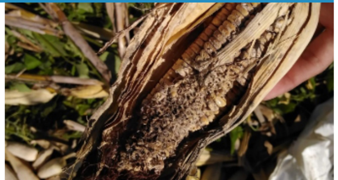
Cultivos de maíz y frijol dañados por las intensas lluvias