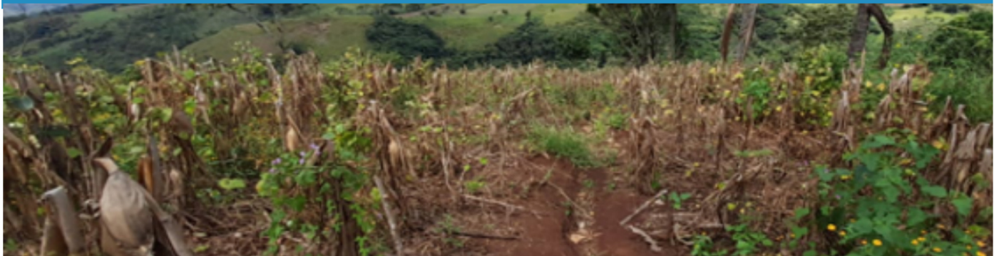
Daño del cultivo de maíz por las constantes lluvias