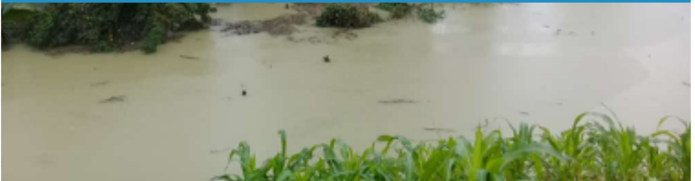
Cultivo de maíz con saturación de agua por efecto de las lluvias