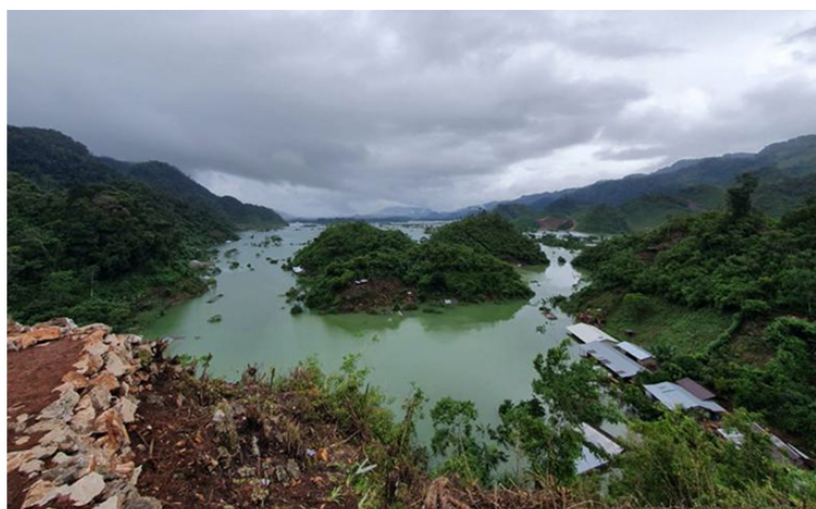
Área inundada en Chisec, Alta Verapaz.

Estos son algunos ejemplos del impacto de la Depresión Tropical IOTA en los departamentos de Alta Verapaz e Izabal.