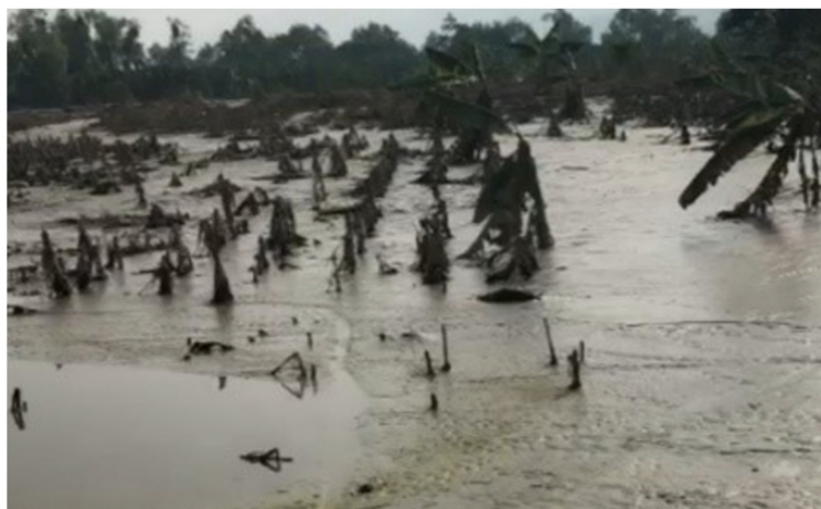
Daño en el cultivos de banano en Morales, Izabal.