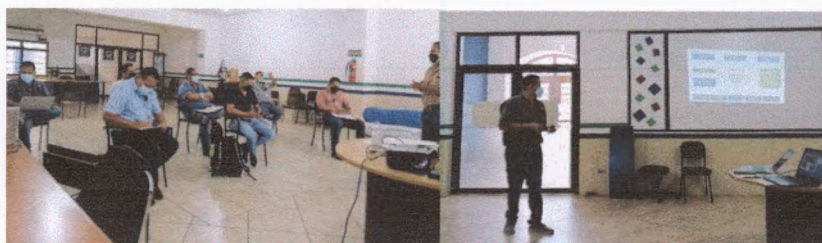
Presentación de la propuesta de formación de la Mesa Técnica Ambiental Forestal y de productividad