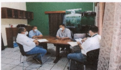
Coordinación institucional Instituto Nacional de Bosques INAB