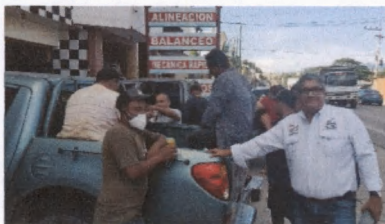
Cuadrilla de técnicos y personal de campo del Consejo Nacional de Áreas Protegidas Región Zacapa.