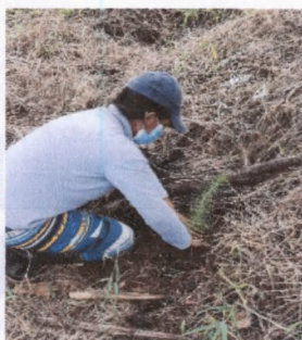
Generación de empleo local.

Fuente: Oficina Territorial, Guatemala 2021