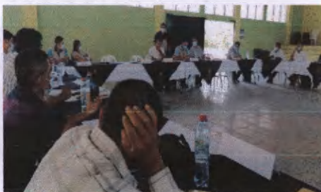
Reunión Reunión delegado COMUSAN-Camotán.

El proceso de acciones estará dirigido por los alcaldes municipales en coordinación con Plan Trifinio, por medio de la participación en La Comisión Municipal de Seguridad Alimentaria y Nutricional del Municipio -COMUSAN- para lograr los objetivos del planteamiento de la gobernanza en el marco de la Seguridad Alimentaria y Nutricional.