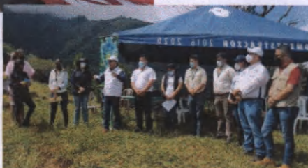
Participación del Director Ejecutivo Nacional