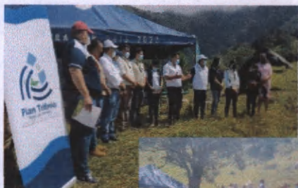
Participación del señor alcalde del Municipio de Concepción las Minas Chiquimula.