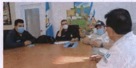
Reunión OMSAN DMM -Jocotán.