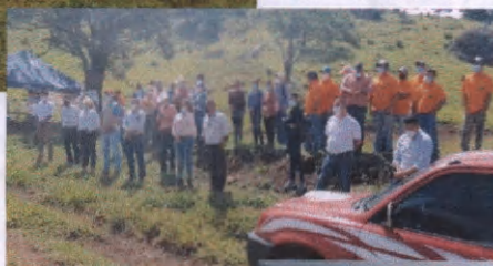
Sector institucional y voluntariado comunitario