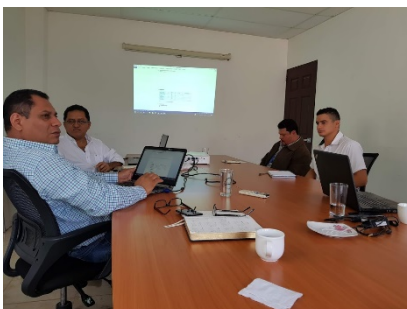
Comité Foro y Competencia MCT 2019