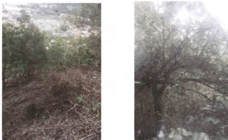
Foto 7 y 8, Área para el establecimiento de regeneración natural 2023.

El establecimiento de las 5 hectáreas de regeneración natural, se tiene previsto realizarlo en el mes de julio, esperando que la temporada de lluvia se establezca, para iniciar con las actividades, para promover el desarrollo de la regeneración natural, que inicia con el chapeo y plateo de la planta que se desarrolla naturalmente dentro del área.