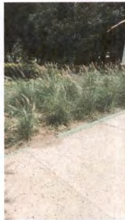
Foto 18 y 19, Mantenimiento de jardines.