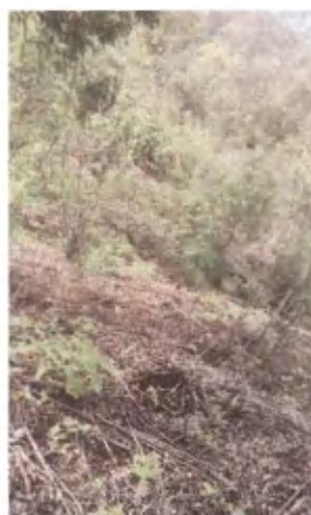
Foto 3 y 4, Replantes en áreas reforestadas.

El establecimiento de las 5 hectáreas propuestas para el año 2023 se estará realizando al establecerse la época lluviosa, para obtener un mejor prendimiento, ya que el área a utilizarse contiene una pendiente del 35%, donde las condiciones de suelo y poca vegetación hace difícil el prendimiento, sin embargo, con suficiente humedad, se puede obtener mejor resultado.