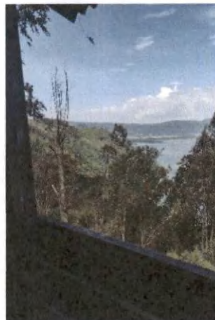
Foto 13 y14, Monitoreo por medio de la torre de control.

Conforme el protocolo interno desarrollado para prevenir el avance de la actual pandemia, no se están prestando todos los servicios y se continúa atendiendo con aforo limitado.