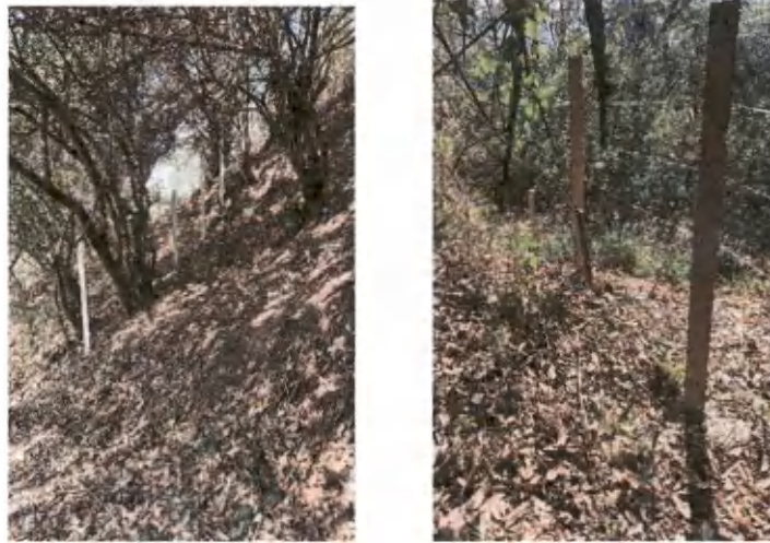
Foto 1 y 2, Verificación de cercos

Las brechas de protección continúan en buen estado, por lo que no se les realizará mantenimiento hasta iniciar la nueva temporada de incendios, que inicia en noviembre.