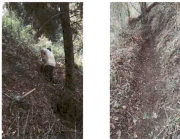
Foto 9 y 10, Mantenimiento de acequias.

Para el establecimiento de las 2 hectáreas propuestas para el año 2023, se estarán realizando en el mes de noviembre, ya cuando la temporada de lluvias termine y las condiciones del suelo sean óptimas para la perforación de la zanja y así evitar que el suelo que sale de la perforación se erosione por las lluvias. Las dimensiones se continuarán con las mismas que son de 0.60m de ancho por 0.40m de profundidad.