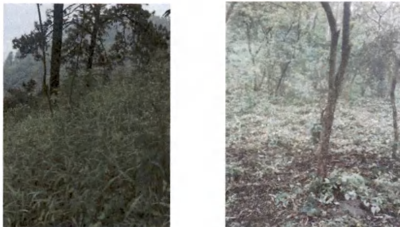
Foto 11 y 12 Área para el establecimiento de acequias 2023.

Para el establecimiento de las 2 hectáreas propuestas para el año 2023, se estarán realizando en el mes de noviembre, ya cuando la temporada de lluvias termine y las condiciones del suelo sean óptimas para la perforación de la zanja y así evitar que el suelo que sale de la perforación se erosione por las lluvias. Las dimensiones se continuarán con las mismas que son de 0.60m de ancho por 0.40m de profundidad.