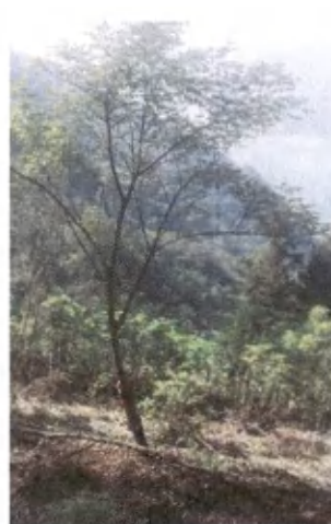
Foto 5 y 6, Área para establecimiento reforestación 2023.