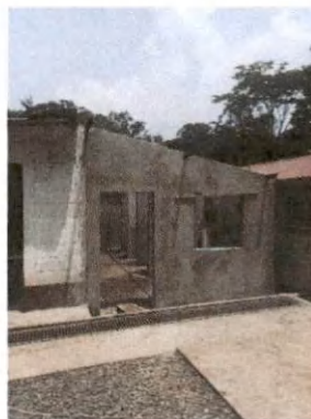
Foto 16 y 17, Construcción de vestidores de personal de PNNU.