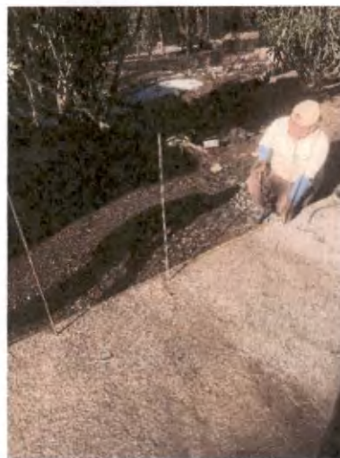
Foto 17 y 18. Reparación de banquetas y construcción de puerta de pozo de infiltración.