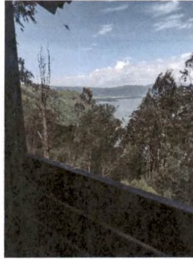
Foto 15 y 16. Monitoreo por medio de la torre de control.

5.8 Otorgar la cooperación técnica y financiera a la Fundación Defensores de la Naturaleza necesite, siempre que se encuentre dentro de sus posibilidades para el desarrollo dentro del Parque Nacional Naciones Unidas de proyectos de Conservación y Manejo de la Cuenca, considerando que el terreno de este Parque Nacional es parte importante de la Cuenca del Lago de Amatitlan, por lo que se hace necesario realizar actividades de protección y manejo de la misma, incluyendo Educación Ambiental dirigida a estudiantes y población que visita el mismo.