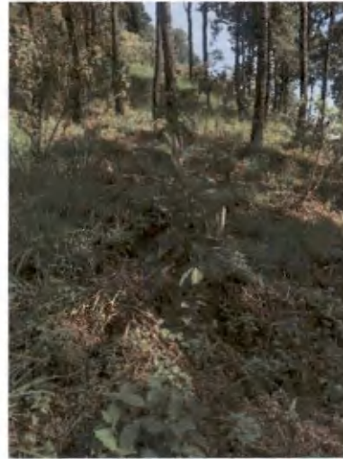
Foto 9 y 10. Posibles áreas para establecer regeneración natural.