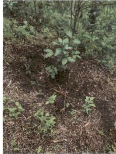
Foto 5 y 6, Planta reforestada

Para el establecimiento del área, para este año 2023, se estará ubicando el área en marzo y abril, debido a que esta actividad se realiza al iniciar las lluvias de la temporada, siendo entre junio y julio.