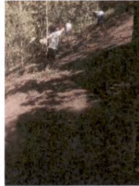
Foto 1 y 2, Mantenimiento de líneas de control o brechas corta fuego.