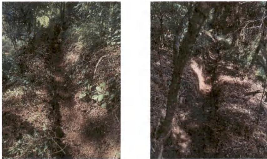
Foto 13 y 14. Estado actual de las estructuras de conservación de suelos.

El establecimiento de las 2 hectáreas para el año 2023, se estará realizando en noviembre, cuando las condiciones del suelo sean óptimas para la perforación de la zanja. El área se estará ubicando en mayo y junio, siempre buscando áreas con pendiente pronunciada, para cumplir con el objetivo de evitar la erosión y que sirvan para la infiltración de agua de lluvia.