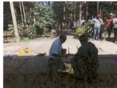
Foto 3 y 4. Capacitación a personal, con incendios forestales.