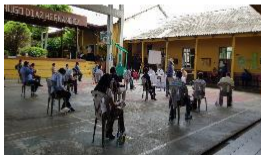
Afiche informativo distribuido en la Región.

La plataforma se apoya de un Call Center, con dos líneas telefónicas que son atendidas por personas con especialidad en enfermería, quienes brindan la asesoría y recomendaciones pertinentes.