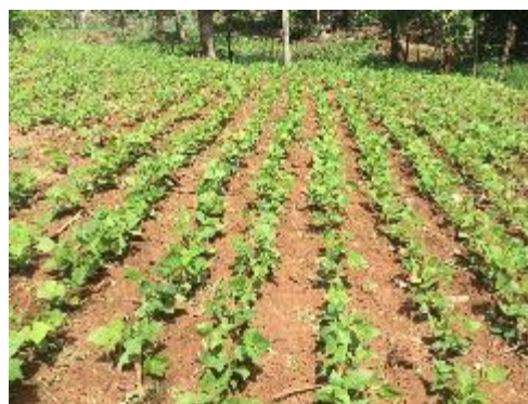
Parcelas de frijol en la región Trifinio, producto de la dotación de semilla, a 700 familias de los departamentos de Jutiapa y Chiquimula