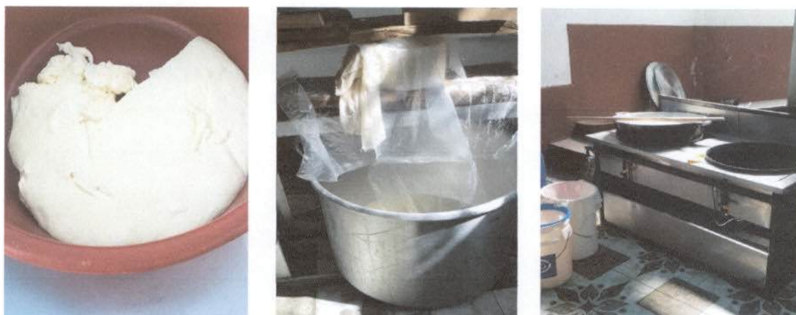
Ilustración 2. Procesamiento de la leche para obtener el producto final.