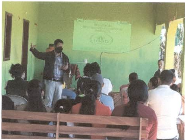
Fotografías de los talleres y/o capacitaciones impartidas: