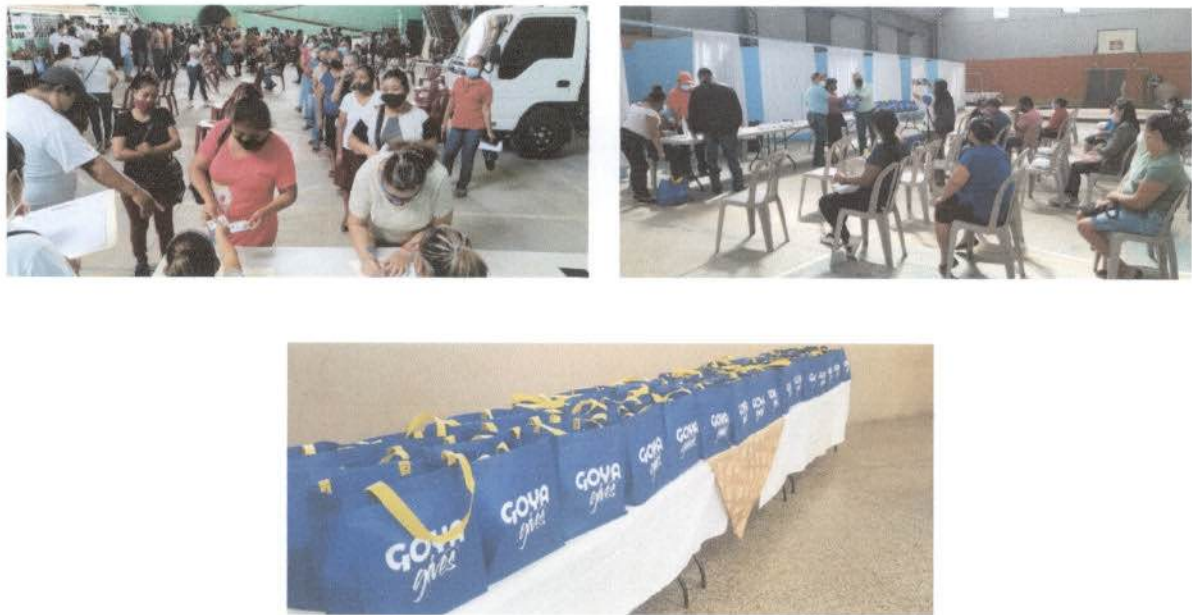
Ilustración 5. Proceso de entrega de alimento proporcionado por la empresa GOYA.