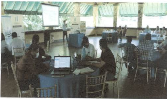
Ilustración 1. Evento de presentación de Resultados de la Consultoría para el Fortalecimiento a la Cadena de Valor de Lácteos.

Como parte del seguimiento y fomento al desarrollo de la coordinación interinstitucional entre el Ministerio de Economía, la Oficina Territorial de Guatemala y organizaciones de ganaderos de la Región Trifinio; se presentaron los resultados de la consultoría en mención. La presentación contó con la presencia de los actores que fueron objetos de intervención: CUNAGRO, R.L., (Cooperativa de productores agropecuarios y servicios varios) AGAYAS, (Asociación de ganaderos y agricultores de Santa Catarina Mita), ALAB (Asociación de lecheros de Agua Blanca) MAGA, (Ministerio de Agricultura Ganadería y Alimentación), del departamento de Jutiapa, Asociación de ganaderos de Chiquimula, APROPARJA, (Asociación de productores agropecuarios) APRODERCH, (Asociación empresarial de la región Chortí), Grupo Ganadero Esquipulas, CASVACHI, R.L. (Cooperativa de productores agropecuarios y servicios varios) Coop. El Manantial, R.L. (Cooperativa de productores agropecuarios y servicios varios) CHIQUIMULJA, R.L. (Ahorro y crédito) Cooperativa COOSAJO (Ahorro y crédito).