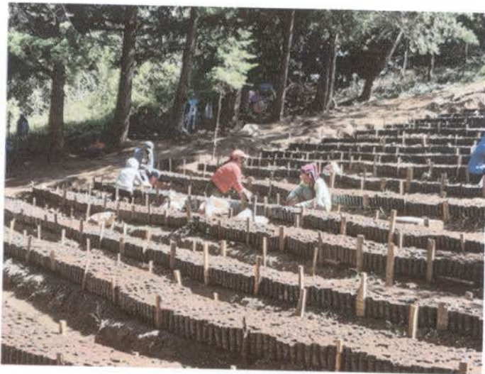
Ilustración 7. Imagen de la preparación de terrazas y cuidado de bolsas llenas.