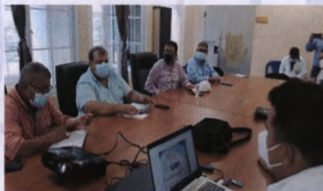
Reunión Equipo SAN, alcalde Municipal, DEN/OT Plan Trifinio

El equipo que maneja la Oficina de Seguridad Alimentaria y Nutricional de la municipalidad, presentó los indicadores y como ha estado comportándose la trayectoria de nutrición aguda en el municipio ubicándose los puntos más críticos en los años 2010 y 2013 con 143 casos cada uno y en los dos últimos años 2020 y 2021, 84 y 56 casos respectivamente, para mantener un monitoreo constante y actualizar información se forman los Consejos Comunitarios de Seguridad Alimentaria y Nutricional -COCOSAN- apoyados por 57 promotores distribuidos por sectores en el área rural.