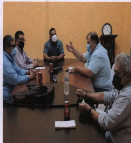
Reunión alcalde Municipal, San Juan Ermita DEN/OT Plan Trifinio