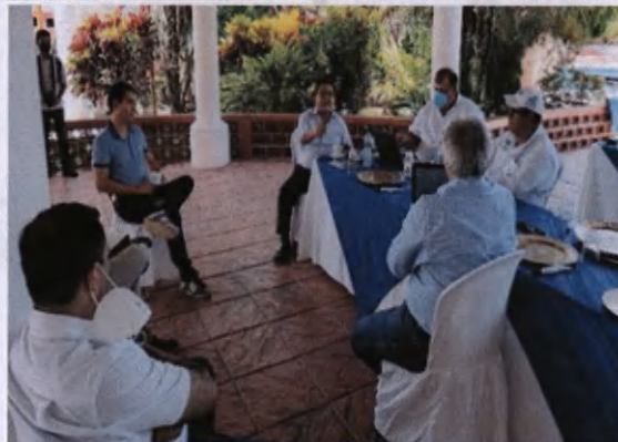
Reunión gobiernos municipales Sta. Catarina Mita, Asunción Mita, Jutiapa. DEN/OT Plan Trifinio

Luego de la discusión fue abordado un tema de mucha importancia para los 4 gobiernos municipales relacionada a la contaminación por el manejo de desechos sólidos, en las cabeceras municipales, situación que se agrava en los 17 municipios del departamento de Jutiapa, siendo un punto con mucha importancia para los 4 alcaldes de la región Trifinio, solicitando el apoyo al director ejecutivo nacional, quien manifestó que deberá realizarse la idea del proyecto, para formular el estudio de factibilidad de una Planta de tratamiento de desechos sólidos, se realizará la tarea de visita a las municipalidad para obtener información que nos aporte datos para la idea del proyecto y gestionar ambas partes el financiamiento para la formulación del estudio a nivel de factibilidad.