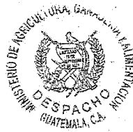
MARIO MÉNDEZ MONTENEGRO Ministro de Agricultura, Ganadería y Alimentación