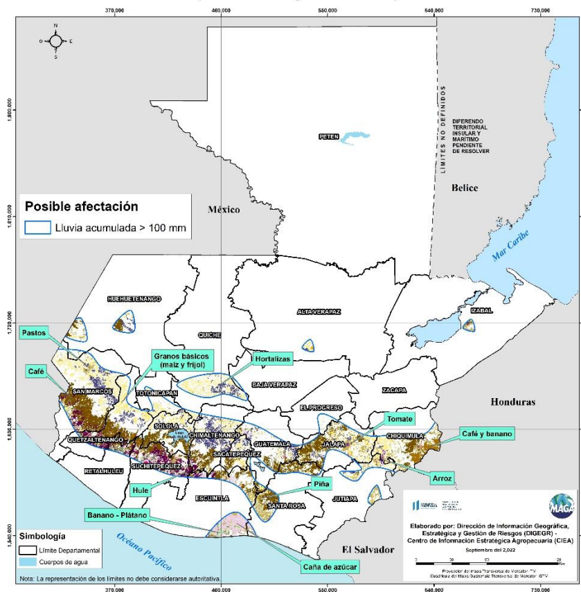
Cultivos monitoreados por condiciones meteorológicas (16 al 19 de septiembre 2022)

De acuerdo al análisis agrometeorológico para este fin e inicio de semana, el Centro de Información Estratégica Agropecuaria identificó los cultivos expuestos a daños por la amenaza de lluvias. Las zonas expuestas pueden visualizarse en el siguiente mapa.