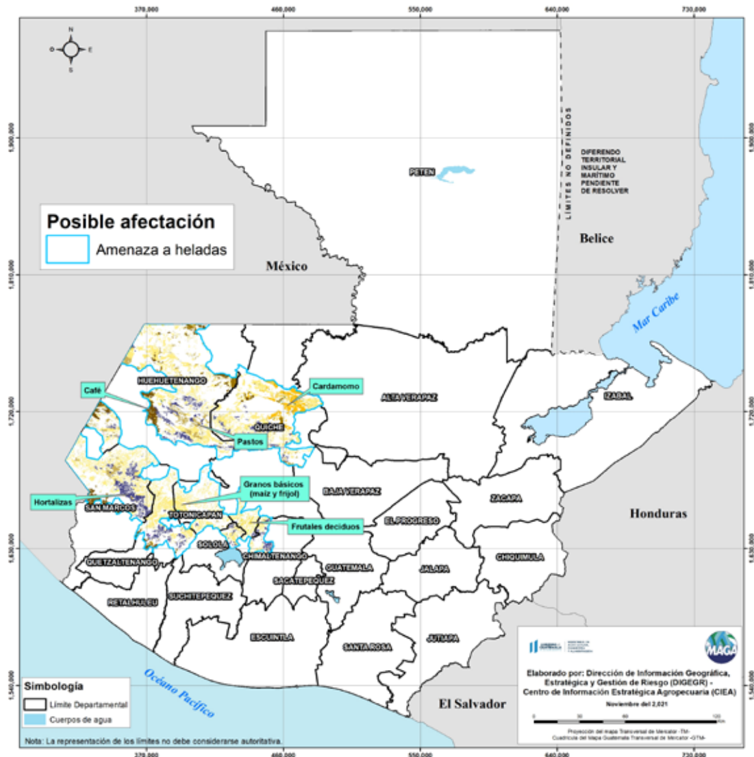
Posibles cultivos afectados por condiciones meteorológicas (26 al 28 de noviembre 2021)

En estas áreas (57 municipios) el MAGA mantendrá el monitoreo constante ante posibles daños a cultivos (maíz, frijol, café, hortalizas, frutales deciduos, cardamomo y pastos), especialmente en los municipios de Todos Santos Cuchumatán, Nentón, Chiantla, Cuilco y Santa Eulalia del departamento de Huehuetenango; Nebaj, Uspantán y Chajul de Quiché y Tacaná de San Marcos.