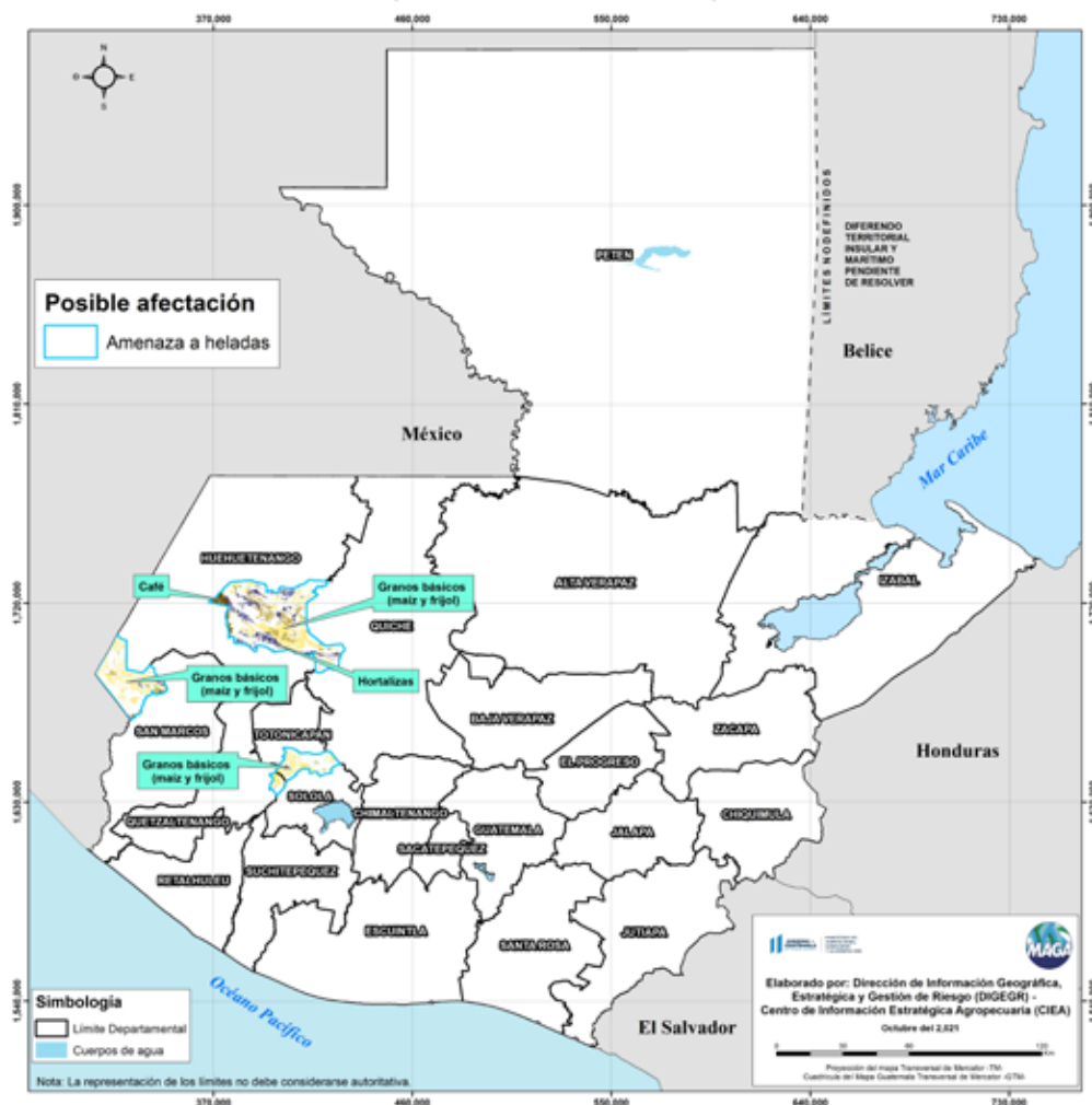
Posibles cultivos afectados por condiciones meteorológicas (29 al 31 de octubre 2021)

En estas áreas (10 municipios) el MAGA mantendrá el monitoreo constante por posibles daños a cultivos (maíz, frijol, café y hortalizas), especialmente en los municipios de San Sebastián Huehuetenango y Todos Santos Cuchumatán del departamento de Huehuetenango.