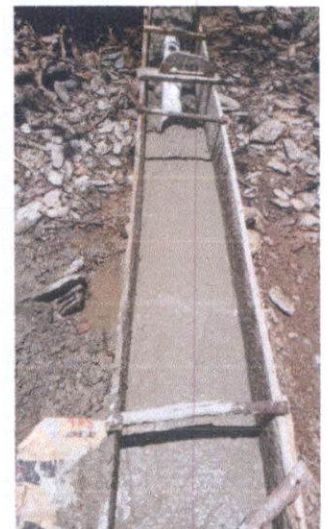
Revestimiento de la tubería de 5" de 125 PSI PVC.