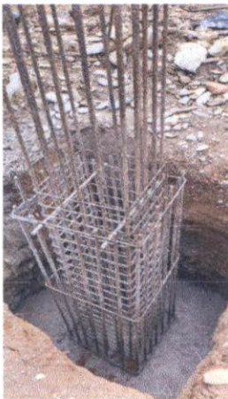
Columnas de los pasos aéreos.