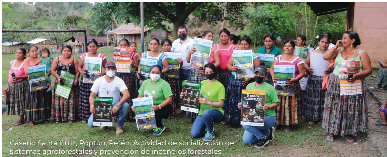
Caserío Santa Cruz, Poptún, Petén. Actividad de socialización de sistemas agroforestales y prevención de incendios forestales.

Durante los meses de marzo, abril y mayo los educadores ambientales continúan priorizando el tema de prevención de incendios, principalmente en zonas aledañas a las áreas protegidas, lugar donde se encuentra la mayor biodiversidad de flora y fauna del departamento.