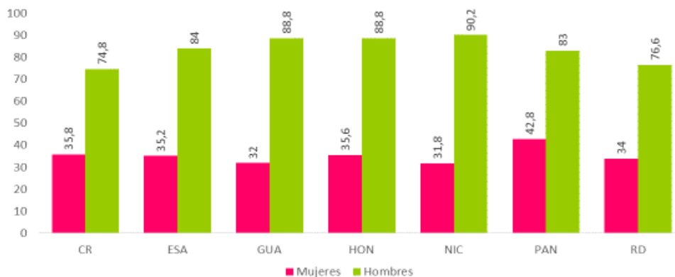
Gráfico 1: Tasa de participación económica de la población rural, todas las edades, según sexo, 2009-2014 (porcentaje de la población económicamente activa de 15 años y más)

Fuente: SISCA/ SICA con información de CEPAL, 2017 1 .