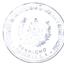
Oscar David Bonilla , Ministro de Agricultura, Ganadería y Alimentación