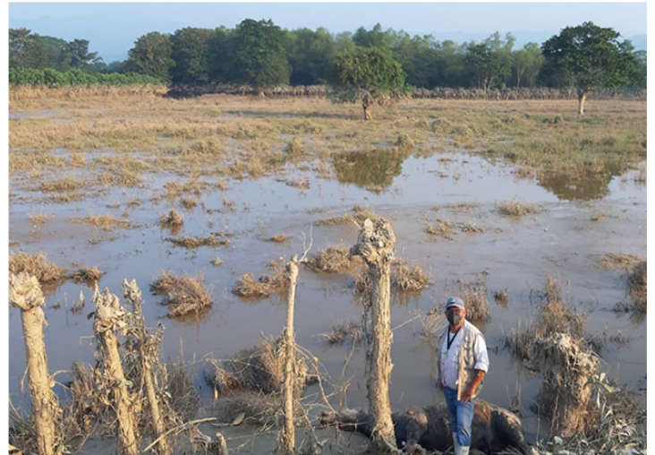
Potrero inundado con un equino muerto.