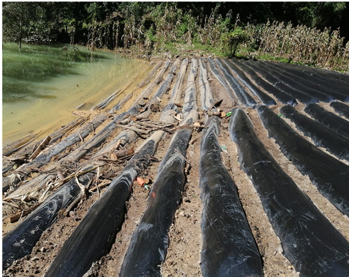
Cultivos de fresa en la comunidad de Quisis, San Juan Cotzal.