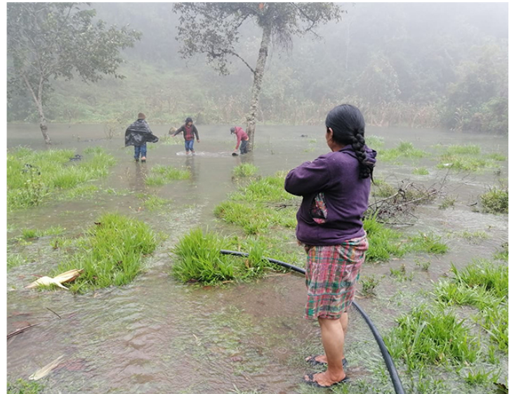
Agricultores verificando los daños en áreas de cultivos.