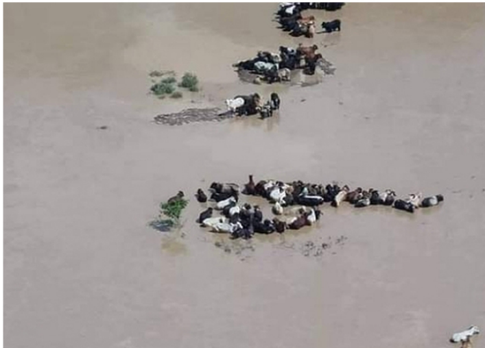
Isla de vacas vivas tratando de sobrevivir sobre las muertas.