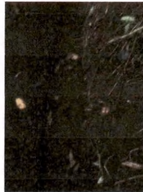
Foto 9 y 10, Establecimiento de estructuras de conservación de suelos, (acequias).

El monitoreo del área se estableció diario. Se presentaron lluvias durante el mes, ayudando a que la maleza se mantenga verde y atrase las condiciones para los incendios forestales. Sin embargo, se mantiene en las horas críticas de calor, que son de 12.00 a 15:00 horas de todos los días.