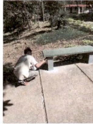
Foto 13 y 14, Reparación de cernido de búcaro de Plaza Antigua y pintado de bancas.