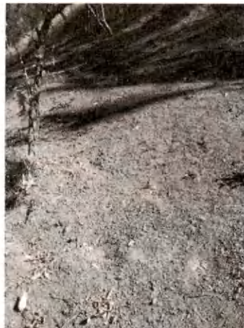
Foto 1 y 2, Brechas de protección con mantenimiento, a suelo mineral.