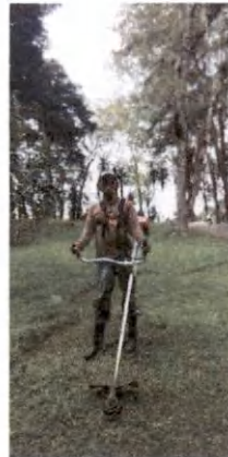
Foto 17 y 18, Reparación de paredes de Plaza Antigua y chapeo de áreas verdes.