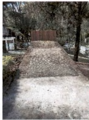
Foto 15 y 16, Aplicación de pintura y reparación de puente.