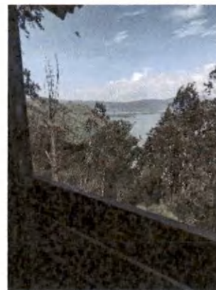
Foto 11 y 12, Monitoreo por medio de la torre de control.