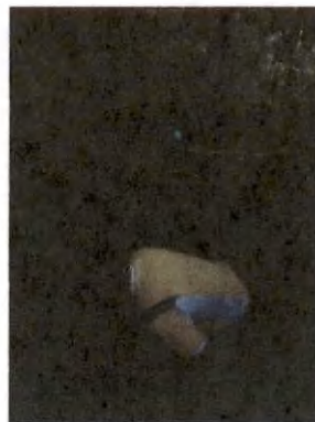
Foto 7 y 8, Mantenimiento de estructuras de conservación de suelos.