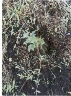
Foto 5 y 6, Áreas de regeneración natural.

En el mes se realizó el mantenimiento de 69.3 hectáreas, para completar las 68 hectáreas establecidas de estructuras de conservación de suelos, (acequias), el cual consistió en sacar la tierra de zanja, para darle las dimensiones establecidas y el chapeo de la barrera viva, para esperar la próxima temporada de lluvias. Aunque en el mes se dieron algunas lluvias, estas no afectaron el estado de las mismas. Esta actividad se realizó con el personal de jornaleros contratados, con una tarea diaria de 100 lineales por persona, completando así el resultado al 100%.