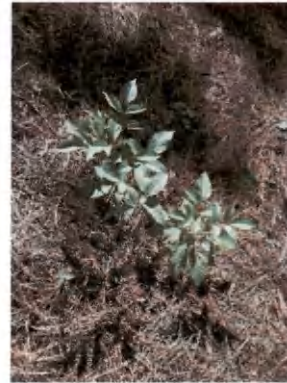
Foto 4 y 5, Estado actual de plantas reforestadas.

Las 5 hectáreas establecidas en el año 2022 se encuentran en buenas condiciones de salud luego del plateo realizado el mes pasado. Se han identificado 4 especies de regeneración natural, las cuales son: