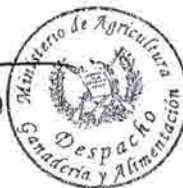
Ing. Agr. Elmer Alberto López Rodríguez Ministro de Agricultura Ganadería y Alimentación

cumplimiento a lo que establece el Artículo 27 del Decreto 30-2012. POR TANTO: El Despacho Ministerial del Ministerio de Agricultura, Ganadería y Alimentación, RESUELVE: PRIMERO: Aprobar la reprogramación del renglón de gasto 031 "Jornales", adjunta en cuadros Excel, la cual forma parte de la presente resolución. SEGUNDO: Envíese fotocopia certificada a la Contraloría General de Cuentas, y Dirección Técnica del Presupuesto del Ministerio de Finanzas Públicas, a la Subdirección de Recursos Humanos y a la Unidad de Administración Financiera (UDAF) de este Ministerio, conforme la Ley.-----